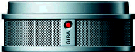
(Optischer Rauchmelder Fabr. Gira)

Brandrauch ist in jeder Wohnung und für jeden Menschen ein ungebeter und vor allem unerbittlicher Gast. Der entstehende Schaden ist unermesslich. In der Bundesrepublik sind pro Jahr mehr als 800 Tote bei Bränden in Wohnungen und Eigenheimen zu beklagen. Brandrauch füllt innerhalb kurzer Zeit nach Brandausbruch eine Wohnung vollständig aus. Der hohe Kohlenmonoxidgehalt im Rauch lässt schlafenden Personen bewusstlos werden. Häufig tritt der Erstickungstod schon ein, bevor die Feuerwehr überhaupt alarmiert ist. Tun Sie etwas für die Sicherheit Ihrer Familie. Nutzen Sie im häuslichen Bereich Rauchmelder als ein lebensrettendes Frühwarnsystem.